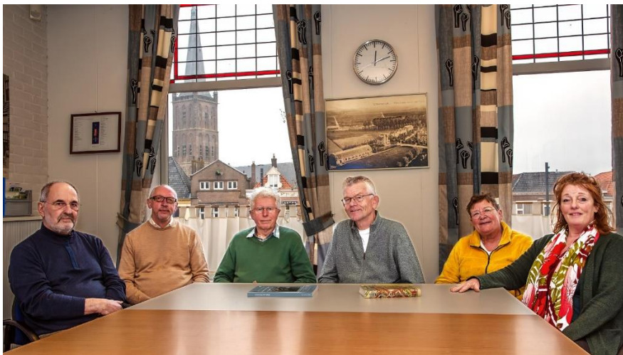
Het bestuur van de HVSeO in 2024.