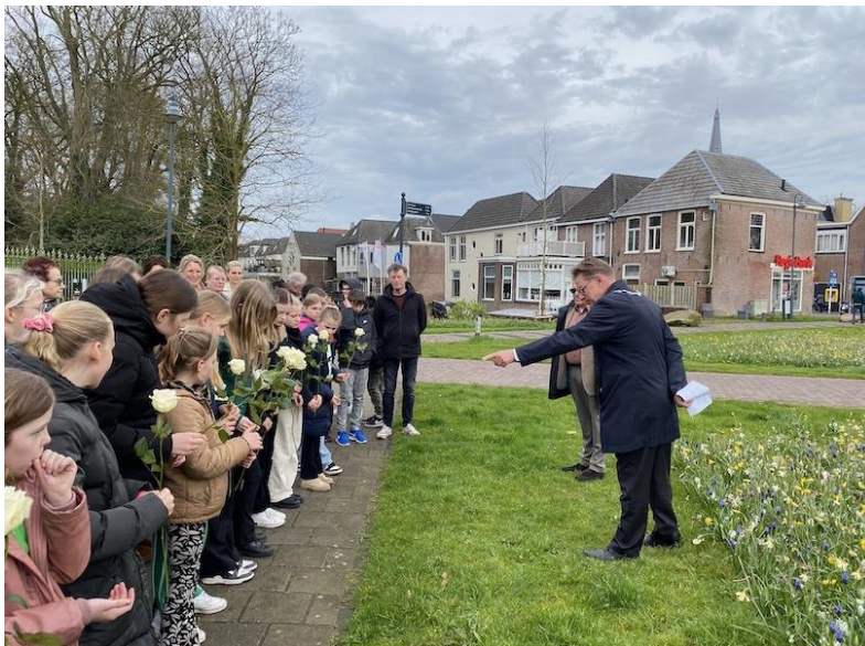
Gastles in de Gasthuisstraat.