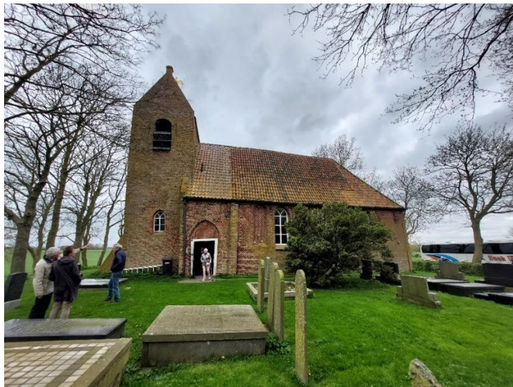
Excursie naar enkele Groninger kerken in 2024.