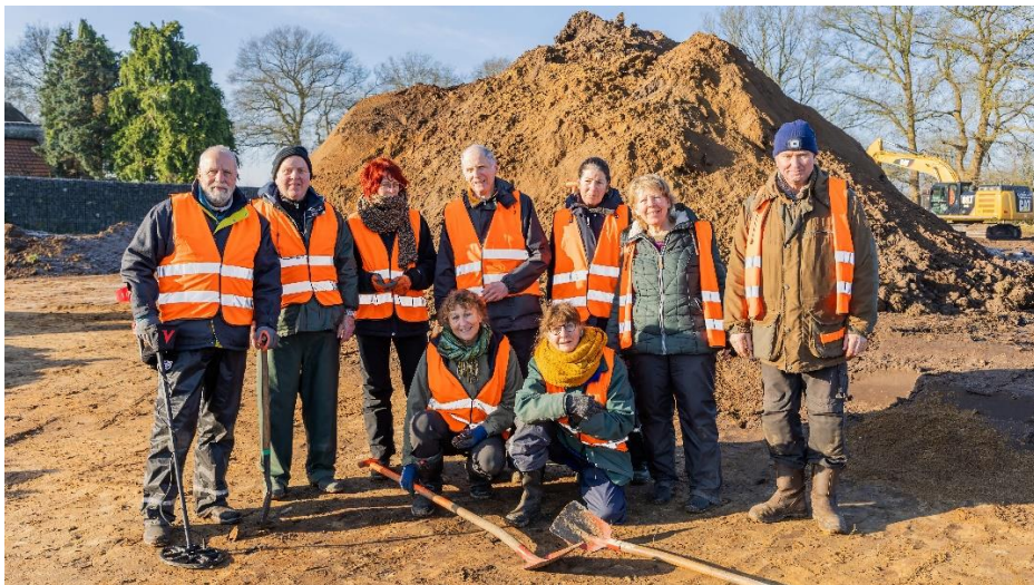
Opgravingen in het Kornputkwartier door het team van de WAS.