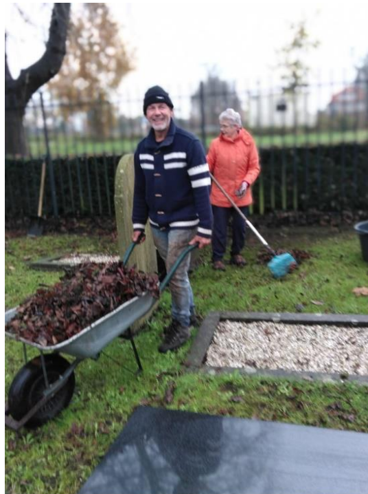
Onderhoud Joodse begraafplaats.