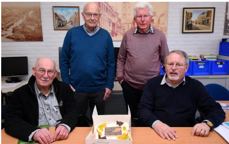
Taart van de week voor het redactieteam.