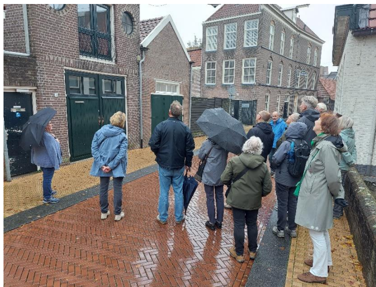
Stadswandeling "Echt of Nep?"