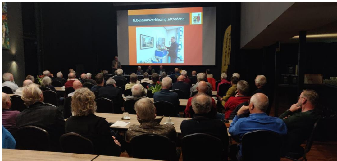
De drukbezochte Algemene Vergadering in 2024 (foto: Liesbeth Hermans).